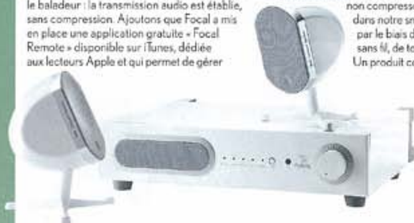
130 | DIAPASON

tous les systèmes utilisant la technologie Kleer. Nous avons relié notre lecteur CD au Power Bird. La qualité est surprenante, presque comparable à celle d'une très bonne chaîne de salon. Pour trouver le meilleur équilibre spectral, on régle le niveau de grave du caisson, à l'aide du bouton placé à l'arrière de l'amplificateur. L'éloignement des deux satellites Bird contribue à la crédibilité de l'image stéréo, excellente. Enfin, la dynamique associe la subtilité et l'expressivité à une opulence bienvenue. L'écoute des fichiers non compressés contenus dans notre smartphone est, par le biais de la transmission sans fil, de tout premier ordre. Un produit coup de cœur.