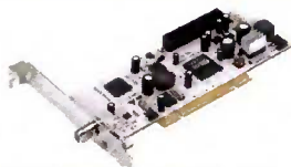
Terratec E7 PS2 CI. La carte tuner satellite DVS-S/S2 Anysee E7 PS2 au format PCI avec son emplacement pour module de décodage CI. www.terratec.net/fr